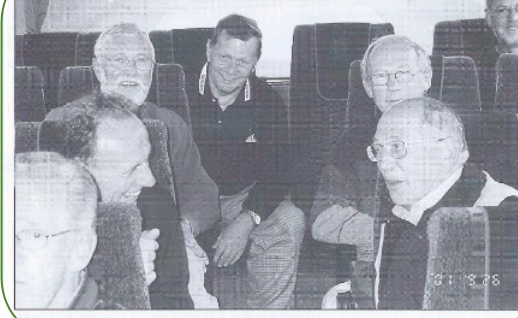
Busen i Faaborg spilles en gang mere på vejen hjem i bussen.

Seniorklubben og morgenfruerne indtager Sønderjyllandsbanen