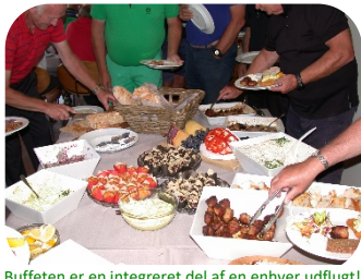
Buffeten er en integreret del af en enhver udflugt!